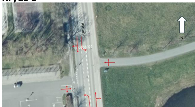
Figur 3 – Eksisterende udformning

På figur 3 ses den eksisterende udformning for kryds 3. Efter NIRAS' rapport udvides krydset med to svingspor som en del af etablering af lysreguleringen. Hvis de nuværende forhold fastholdes, så der kun er et spor ud fra adgangsvejen, kan det på trods af manuel