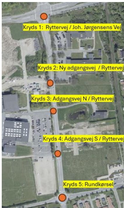
Figur 1 - oversigt over adgangsvveje og kryds på Ryttervej

Adgangsvveje og krydsene ses på figur 1. Adgangsvvejene navngives som kryds 1, 2, 3 m.m.